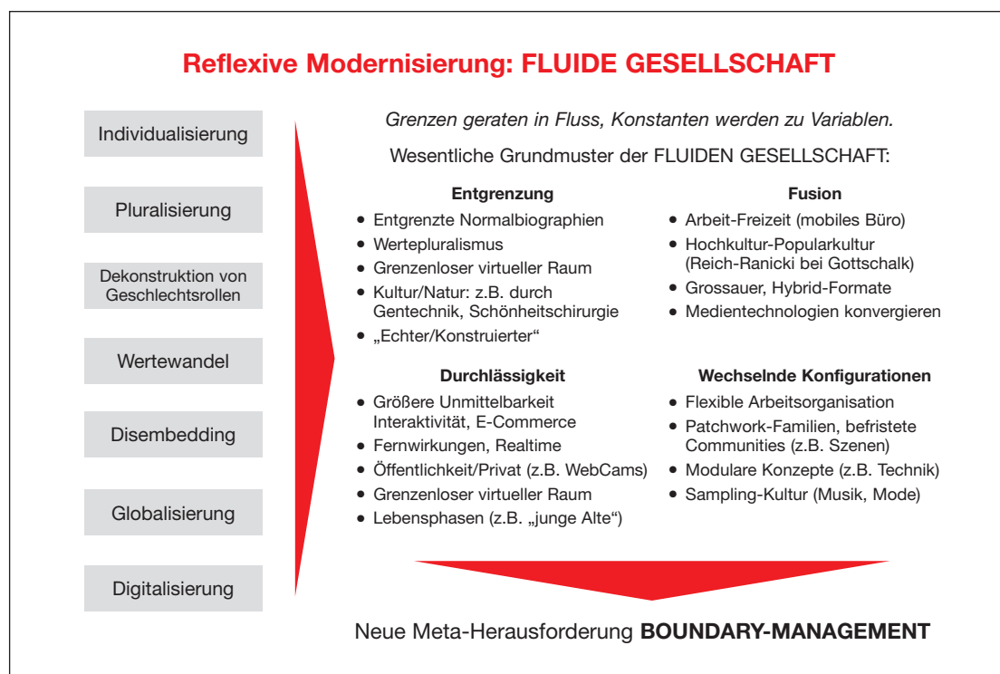
Grafik 1: „Reflexive Modernisierung: FLUIDE GESELLSCHAFT“

An den aktuellen Gesellschaftsdiagnosen hätte Heraklit seine Freude, der ja alles im Fließen sah. Heute wird uns eine „fluide Gesellschaft“ oder die „liquid modernity“ (vgl. Bauman 2000) zur Kenntnis gebracht, in der alles Statische und Stabile zu verabschieden ist.