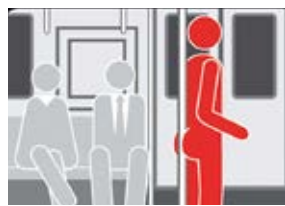
„Grasp poles between hands, not butt cheeks“, Plakat NY Subway