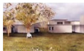
Das Vinzidorf Wien ist im Bau

stehen Wohnmodule für 16 Menschen, die es am „normalen“ Wohnungsmarkt nicht schaffen. Das Vinzidorf Wien erhält kein Geld aus öffentlicher Hand und ist auf Spenden angewiesen. Gesucht werden handwerkliche Unterstützung auf der Baustelle und Sachspenden wie zB Einrichtungsgegenstände. Besonders wichtig: die finanzielle Unterstützung! Spendenkonto: Vinzidorf Wien IBAN AT71 2011 1288 4708 7100, Kontakt: vinzidorfwien@vinzi.at