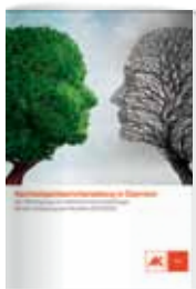
Ulrich Schönbauer, Christina Wieser: Nachhaltigkeitsberichterstattung in Österreich. AK Wien, Abteilung Betriebswirtschaft, 2015

Bereits seit 15 Jahren setzt die EU Initiativen für eine substantielle Nachhaltigkeitsberichterstattung. Jüngstes Beispiel ist die „RL 2014/95/EU zur Angabe nichtfinanzieller und die Diversität betreffender Informationen durch bestimmte große Unternehmen und Gruppen“ (NFI-RL), deren Umsetzung bis Ende 2016 erfolgen muss. In einem öffentlichen Konsultationsverfahren des Justizministeriums spricht sich die überwiegende Mehrheit der