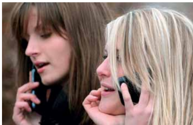
Handy-Strahlung ist nicht gesund.

Die AUVA-Studie zeigt keine direkte Gesundheitsgefährdung, gibt aber Anlass zur Empfehlung, die eigene Exposition zu minimieren. „Denn der Großteil der vom Handy abge-