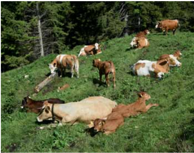
Eine rindergerechte Haltungsform schaut so aus.