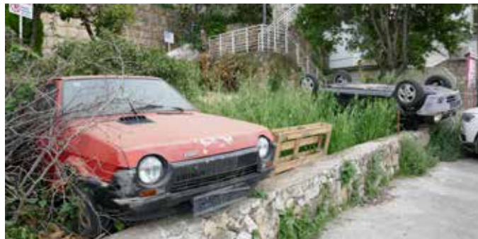
Leichte, kleine Pkw will wohl keiner mehr haben.

über dem Vorjahr. Dieser Anstieg ist aber nicht auf einen sinkenden Marktanteil von Diesel-Modellen (44,8 statt 49,9%) und einen höheren Marktanteil von Benzinern (49,9 statt 45,8%) zurückzuführen. Grund sind vielmehr höhere CO 2 -Emissionen bei Diesel-Pkw (117,9 statt 116,8 g/km), während bei Benzinern die Emissionen mit 121,6 g/km konstant blieben. Der Marktanteil von alternativen Pkw ist 2017 (+42%) zwar rasant angestiegen, macht aber 2017 insgesamt erst 1,5% aus. Wichtig für den CO 2 -Ausstoß ist auch das Pkw-Gewicht. Im Durchschnitt wogen 2017 neue Pkw 1390 kg. Auch hier ist der „klimafreundliche“ Diesel-Pkw um 283 kg schwerer als der Benzinern, wiewohl letzterer 2017 um 27 kg zugenommen hat, während der Diesel-Pkw sein Gewicht halten konnte. FG