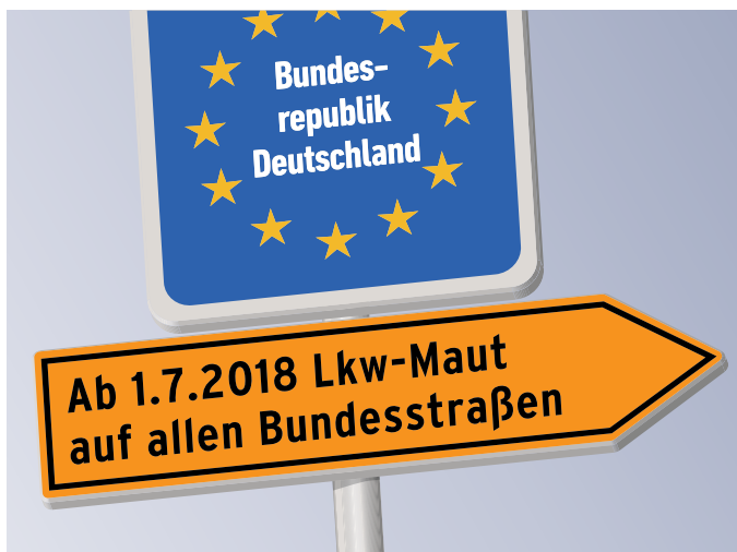
Deutschland weist den richtigen Weg.

zu sorgen. Dass es geht, zeigt Kopenhagen vor. Bedeutend mehr Umsatz für Geschäfte entlang stark befahrener Radwege als an von Autoverkehr geprägten Achsen, weniger Unfälle und ein Radanteil von weit mehr als 50% sind die Folge einer intelligenten Infrastrukturpolitik. In Kopenhagen werden nur 23 € pro EinwohnerIn und Jahr in die Radinfrastruktur gesteckt. Beim Radwegbau hinkt Österreich weit hinterher. So gibt man in Niederösterreich 1,5 €, in Wien 3 €, in Tirol 2,6 € und in Salzburg 7,2 € je EinwohnerIn aus. GL