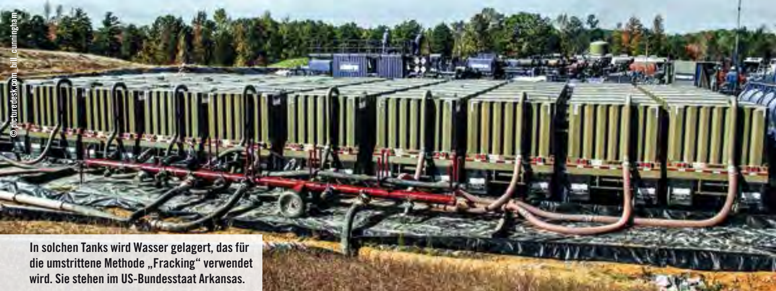
In solchen Tanks wird Wasser gelagert, das für die umstrittene Methode „Fracking“ verwendet wird. Sie stehen im US-Bundesstaat Arkansas.

ten Stoffe zu beurteilen. Dabei waren selbst sie auf die freiwillige Auskunft der Hersteller angewiesen.