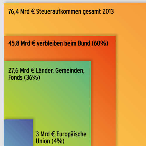
Abbildung 1: Steueraufkommen des Bundes und dessen Verteilung

Der größte Teil der Steuern und Abgaben wird vom Bund eingehoben. Länder und Gemeinden heben lediglich knapp 6 % der Steuern direkt ein. Im Jahr 2013 betrug das Steueraufkommen des Bundes 76,4 Mrd €. Davon wurden an die Länder, Gemeinden und an Fonds 27,6 Mrd € und an die Europäische Union 3 Mrd € überwiesen. Die bedeutendste Steuer, die von den Gemeinden eingehoben wird, ist die Grundsteuer mit einem Aufkommen von 623 Mio € im Jahr 2013. →