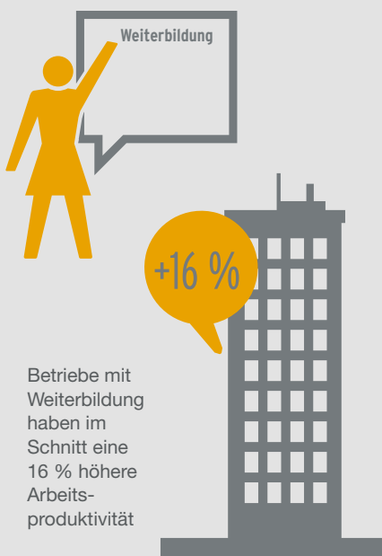
Abbildung 2: Renditen betrieblicher Weiterbildung – ein Rechenbeispiel für ein Unternehmen mit 50 VollzeitmitarbeiterInnen