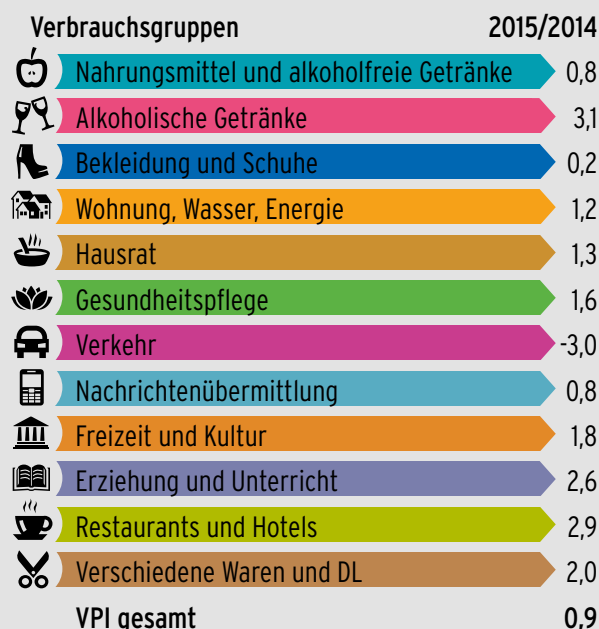
Tabelle 1: Verbraucherpreisindex Veränderungsraten für die Verbraucherguppen Veränderung in %

Insgesamt werden in Österreich 791 Waren- und Dienstleistungspositionen Monat für Monat in Bezug auf ihre Preisentwicklung beobachtet. Diese Beob-