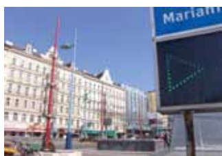
„Shared-Space-Bereich“ soll kommen.

Westbahnhof bis Kaiserstraße und stadteinwärts bis Museumsplatz – wird es „Begegnungszonen“ geben. Dort ist auch für Autos die Zufahrt zu Garagen möglich. Es herrscht eine 20km/h Geschwindigkeitsbegrenzung. Wichtig: In diesem Bereich sind alle VerkehrsteilnehmerInnen gleichberechtigt! Diese Idee stammt aus den Niederlanden und nennt sich „Shared-Space-Bereich“, sie wurde bereits in mehreren Gemeinden Österreichs getestet. Zudem werden eine Reihe von „Mahü“-Querungen unterbrochen und zu