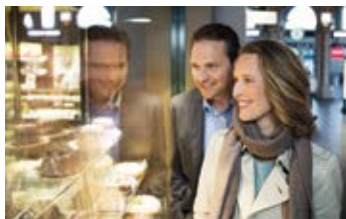
Kommerzialisierung am Züricher HBF

Die Mieten privater Wohnungen treiben die Inflation überdurchschnittlich an. In den letzten acht Jahren ist bei der Neuvermietung von Privatwohnungen der Preis um 43 Prozent, das Haushaltseinkommen jedoch durchschnittlich um nur 22 Prozent gestiegen. Der Grund dafür ist, dass vor allem der Preis für Baugrund und damit auch die verbundenen Preise für Häuser und Wohnungen, seit der Finanzkrise extrem angezogen haben. Im selben Zeitraum sind sie um 80 Prozent teurer geworden! Der Bodenmarkt benötigt deshalb dringende Regulierungen. Deshalb fordert die AK: Um Druck vom privaten Wohnungsmarkt zu nehmen, müssen mehr Gemeinde- und geförderte Genossenschaftswohnungen gebaut werden.