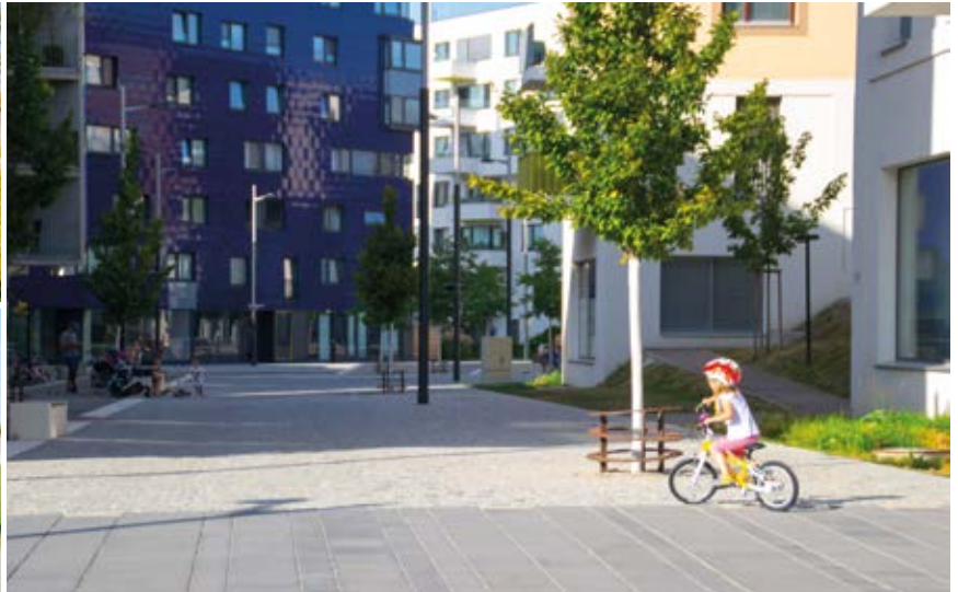
Orte schaffen, die zum Verweilen einladen