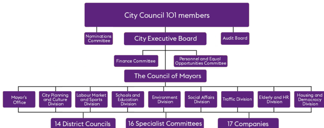
Abbildung 40: Administrativ-politische Struktur Stockholms

Quelle: http://international.stockholm.se/governance/organisation/