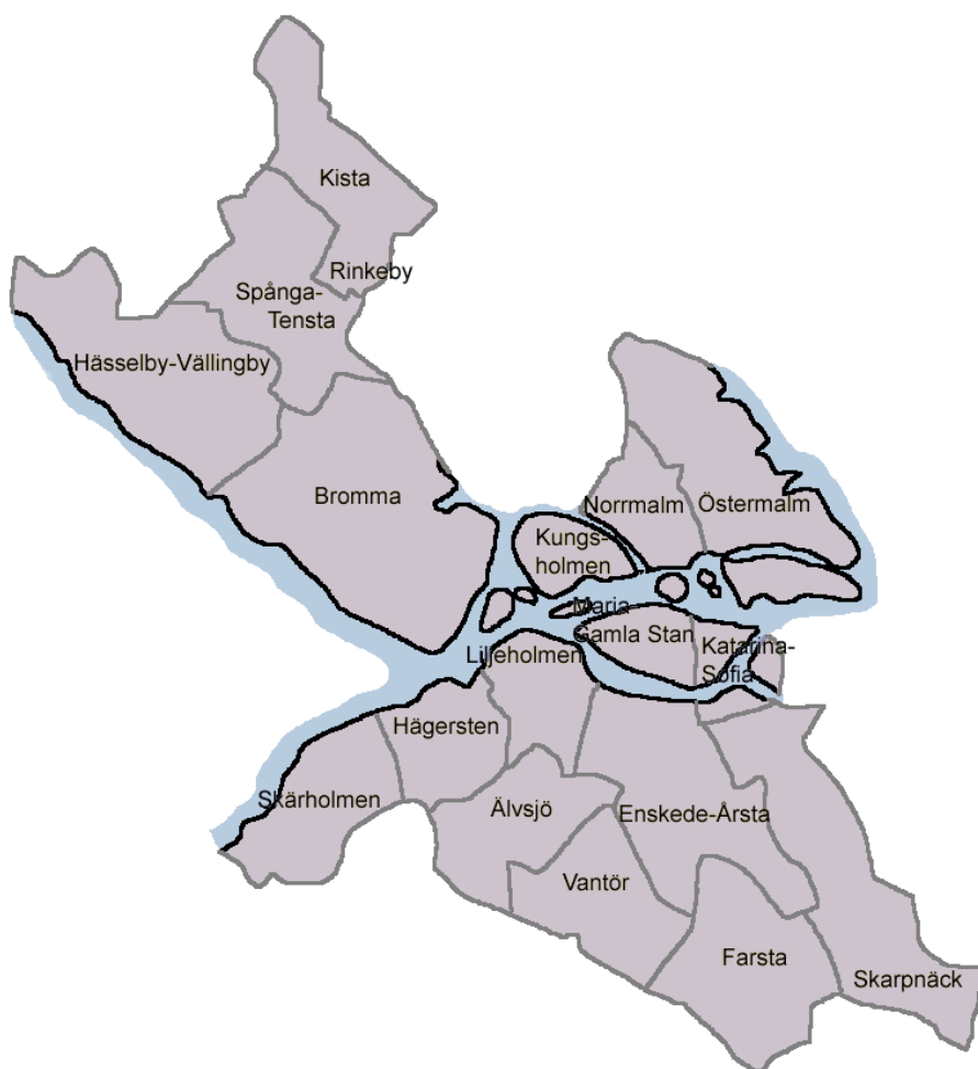
Abbildung 39: Regionale Gliederung der Stadt Stockholm